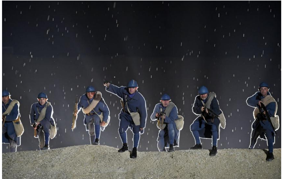
Un assaut réglé au millimètre.

Les dernières nouvelles scènes ont été intégrées en 2016 pour l'anniversaire de la Bataille de Verdun : « On les peaufine ». Les prochaines nouvelles séquences ? Elles seront insérées dans le spectacle qui sera donné en 2019. Il faudra alors, les mettre en scène. Chaque soir, ils