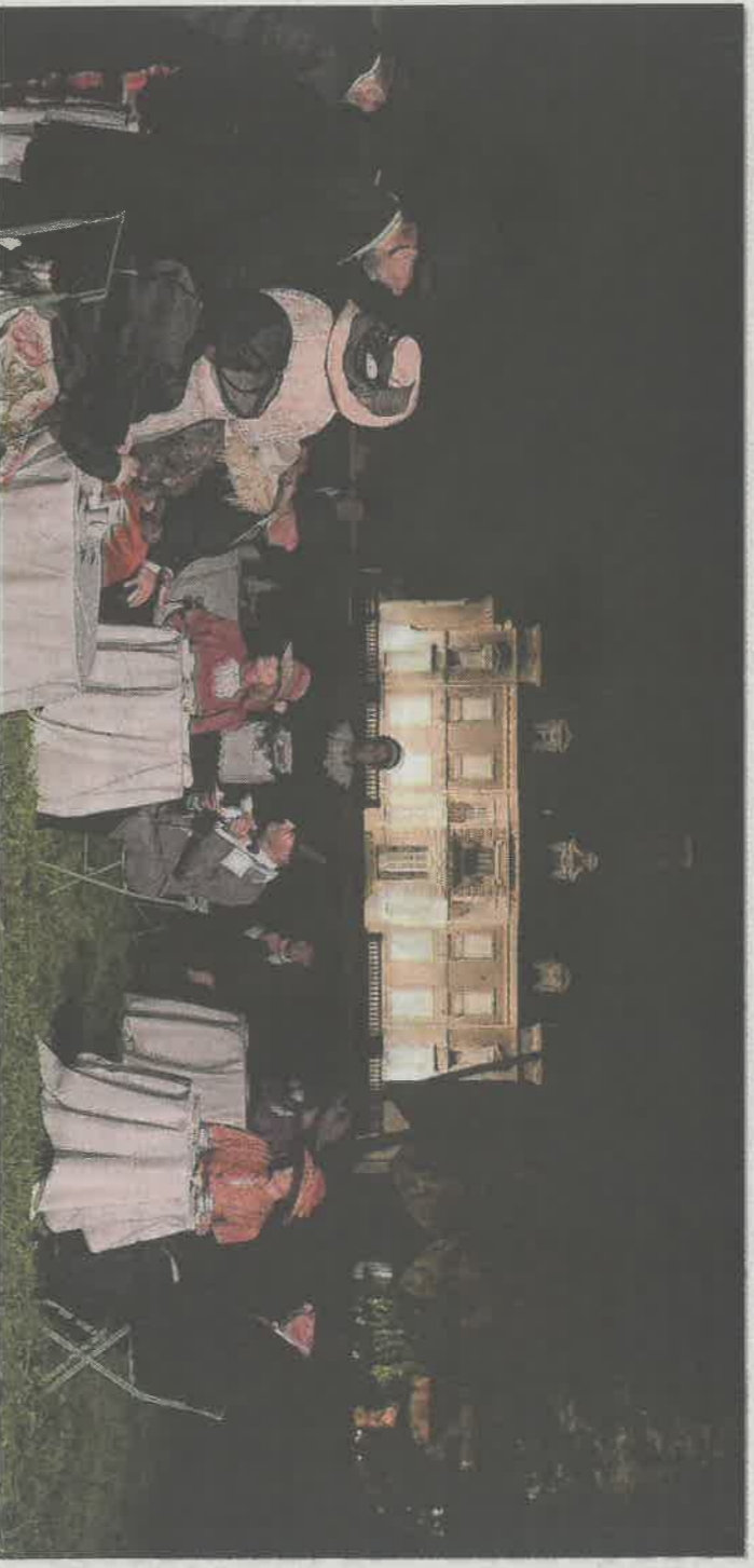
La Balade merveilleuse au château de Thillombois est organisée par Connaissance de la Meuse : entre féerie de lumières, spectacles vivants et musicaux.

À découvrir En continu : tableaux insolites et envoûtants : l'île sonore, l'arche mystérieuse, le peuple de la forêt, les petits bouchons lumineux, l'arbre