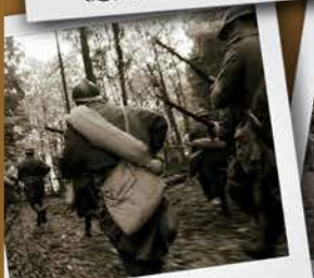
Film historique : La grande tueuse