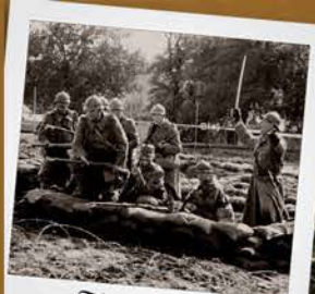
Tranchée de Vauquois

Une simple participation vous sera demandée, afin de couvrir l'entretien du matériel.