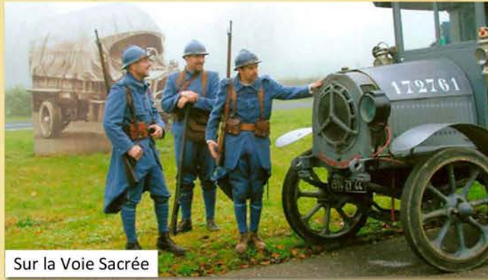
Sur la Voie Sacrée

Le groupe a pour vocation de participer au devoir de mémoire à travers des commémorations ou des évocations historiques.