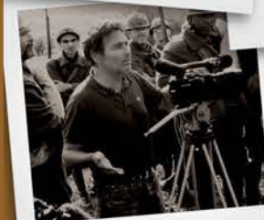
Tournage film : Le soldat Borical