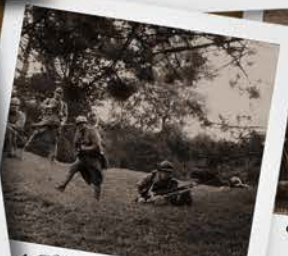
4 Cheminées près de Douaumont