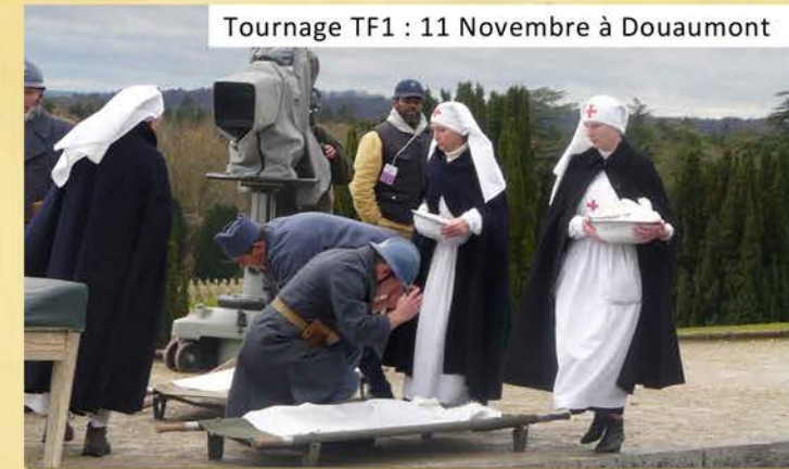
Tournage TF1 : 11 Novembre à Douaumont

Elles correspondent aux uniformes portés lors de la bataille de Verdun en 1916.