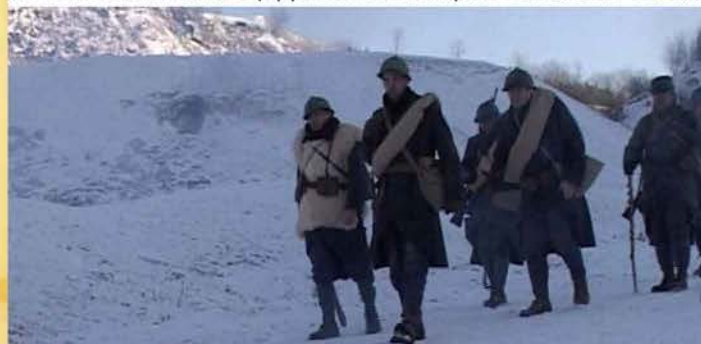
La promotion de la Meuse est passé par les Incontournables poilus. Mais pas seulement.