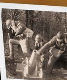
Fort de Troyon