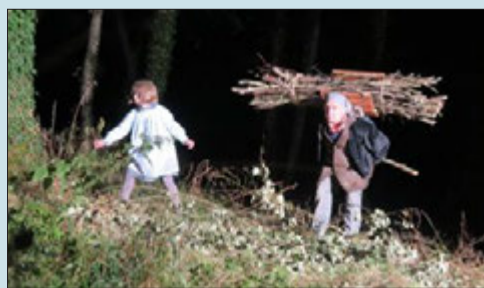
Connaissance de la Meuse recherche aussi des acteurs pour de la figuration.

L'association lance de nouveaux aux volontaires qui voudraient étoffer ses équipes. Il y a la possibilité de s'inscrire dans différents groupes : acteur figurant - « aucune compétence particulière n'est exigée » -, accueil du public (parking, billetterie, contrôle, gestion du public, boutique), son, lumière, intendance (restauration rapide, service des bénévoles), logistique-décors-accessoires (LAD). Pour contacter l'association, c'est soit par mail : cdm@cdm55.fr soit par téléphone : 06.11.54.58.71.