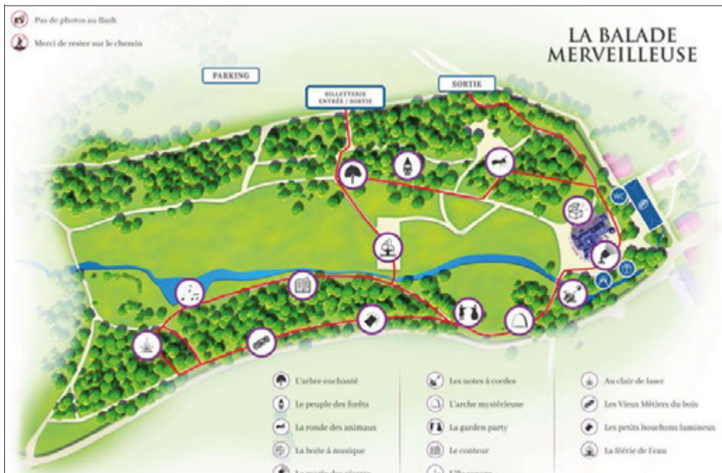
La Balade Merveilleuse organisée les 17, 18, 24 et 25 septembre regroupe quatorze stations à découvrir librement au fil d'une déambulation de 1 500 m.

En continu : tableaux insolites et envoûtants : l'île sonore, l'arche mystérieuse, le peuple de la forêt, les petits bouchons lumineux, l'arbre