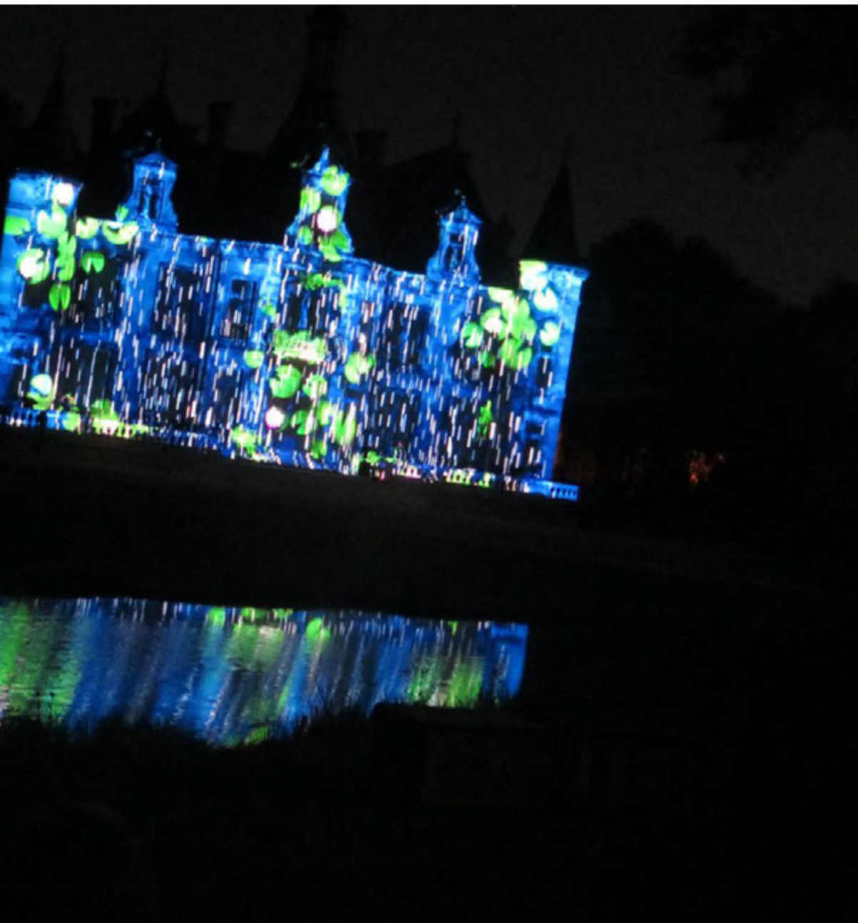
Comme lors de la 1 re édition, la flânerie-spectacle de Connaissance de la Meuse comprendra du mapping vidéo sur une façade du château de Thillombois