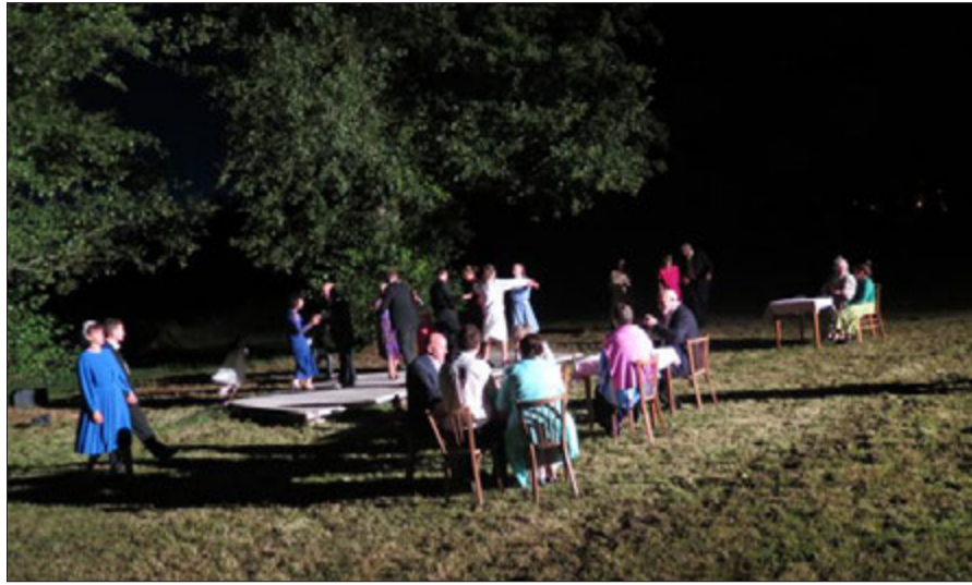
Parmi 14 numéros, la déambulation comprend des scènes jouées, pour lesquels on recherche des acteurs figurants.