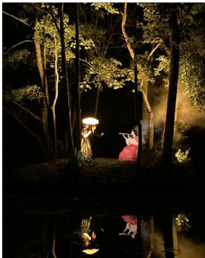
Plusieurs tableaux vivants sont à découvrir tout au long de la flânerie.

La Balade merveilleuse, c'est simple, on peut y aller les yeux fermés, tout en les ouvrant bien grands. Ce sera la plus beau des remerciements qui pourra être fait aux quelque 150 bénévoles qui, pendant