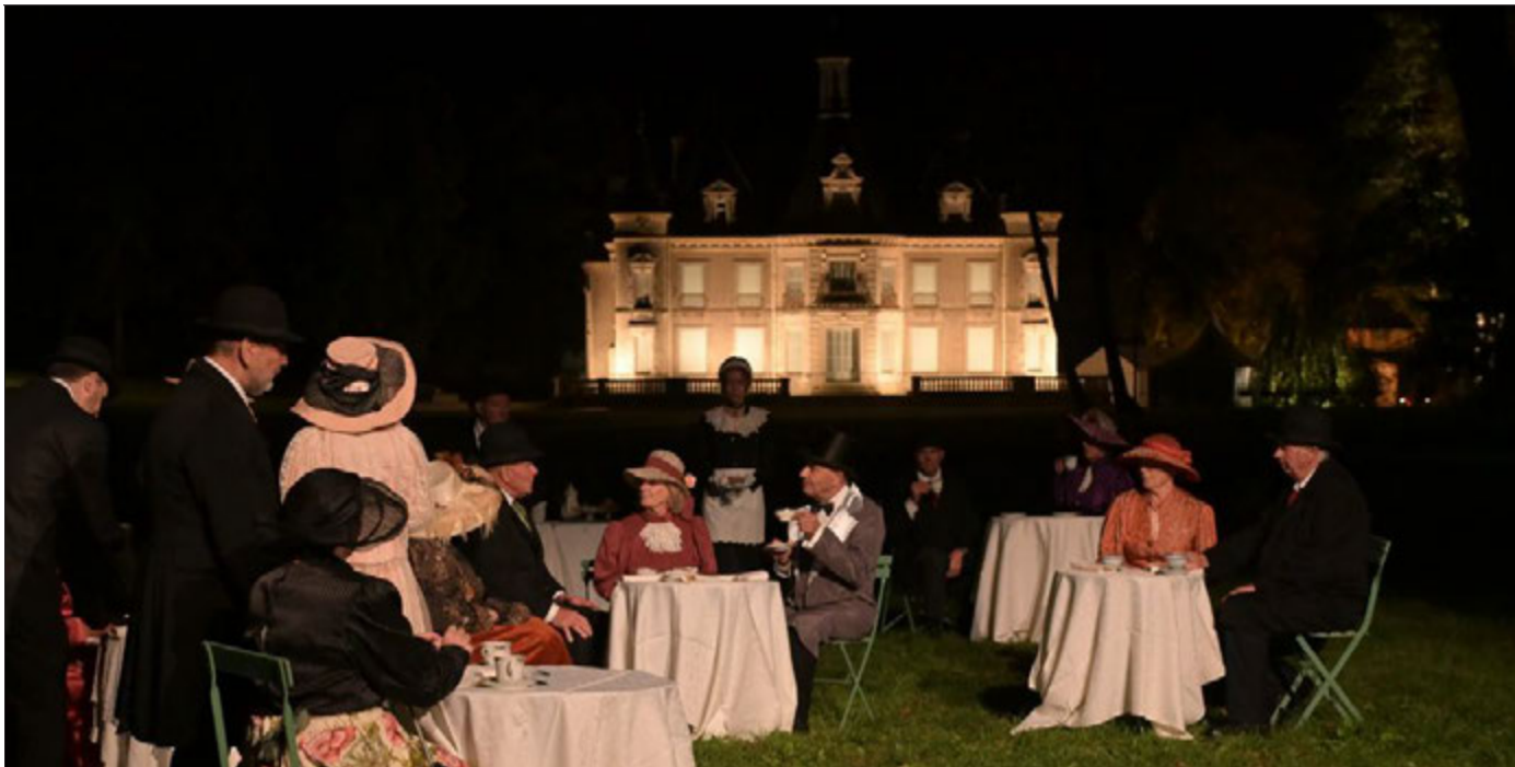
La Balade merveilleuse au château de Thillombois est organisée par Connaissance de la Meuse : entre féerie de lumières, spectacles vivants et musicaux.

C'est le nombre maximal d'entrées fixé volontairement par les organisateurs pour chacune des quatre soirées de représentation.