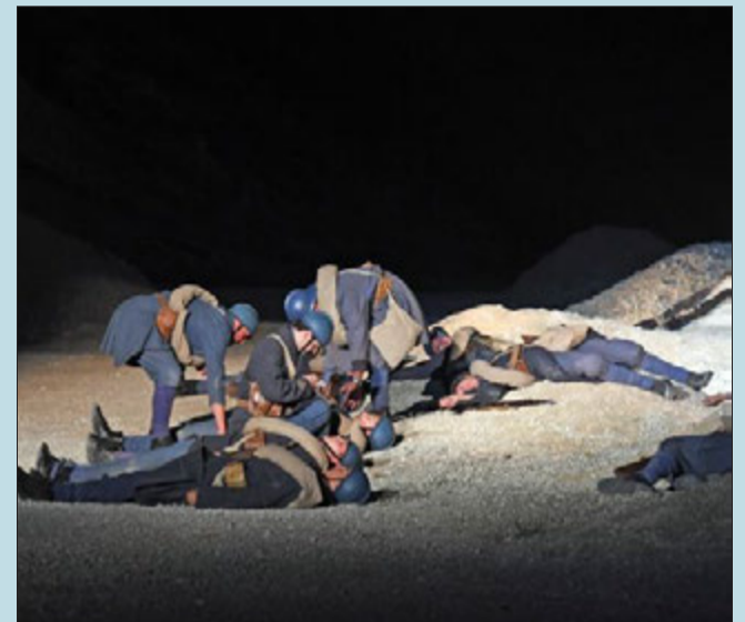
Huit dates au lieu de douze cette année pour l'événement-spectacle « Des Flammes... à la Lumière ».

« Il y a l'envie de se retrouver et de partager quelque chose »,