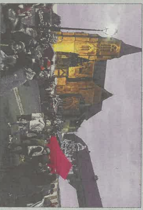
Le village de Noël d'Avioth en 2019 : une belle ambiance.

Cette fin d'année s'annonce féérique en Meuse. Et pas seulement grâce à saint Nicolas. Voilà deux autres opportunités de sortir de chez soi à l'occasion de deux beaux événements.