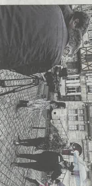
Une scène tournée place Saint-Pierre à Bar-le-Duc.