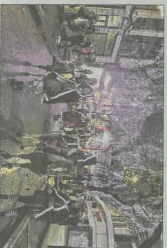
A Verdun, c'est le dimanche 5 décembre qu'aura lieu le défilé de la Saint-Nicolas.

Pas de spectacle avant le défilé, mais à la