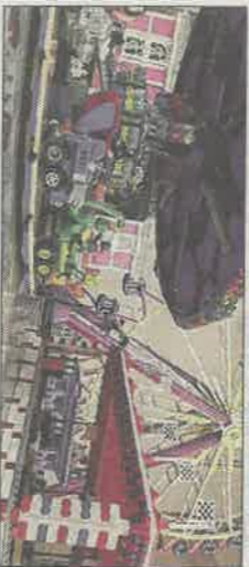
Le record du monde de la plus grande fête foraine en Lego sur près de vingt-cinq mètres linéaires est en jeu au château de Thilloimbois !