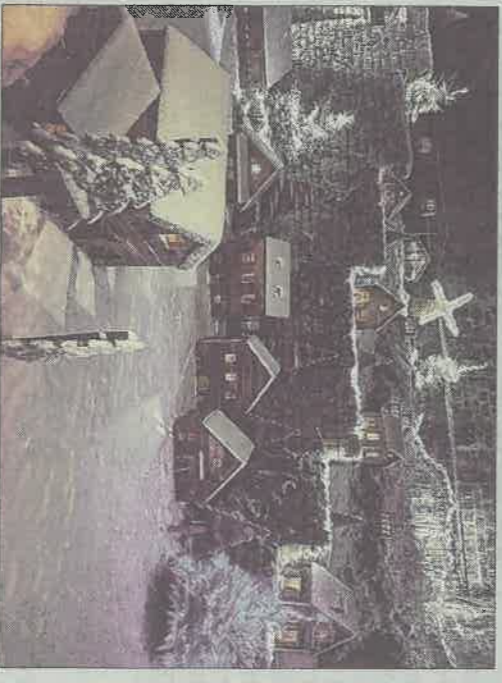
Un spectacle magique avec un village de Noël recouvert de neige.

Si vous avez des jouets en très bon état dont vous ne savez plus quoi faire, apportez-les et déposez-les au pied du sapin dans la basilique, ils seront remis aux Restos du cœur pour les offrir à des enfants défavorisés.