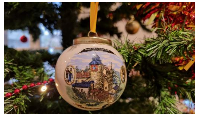
Jamais encore il n'avait été créé de boule de Noël souvenir de Bar-le-Duc.

Des stylos, des porte-clés, des mugs, des cartes postales, des bols..., il existe mille et un cadeaux à rapporter de Bar-le-Duc.