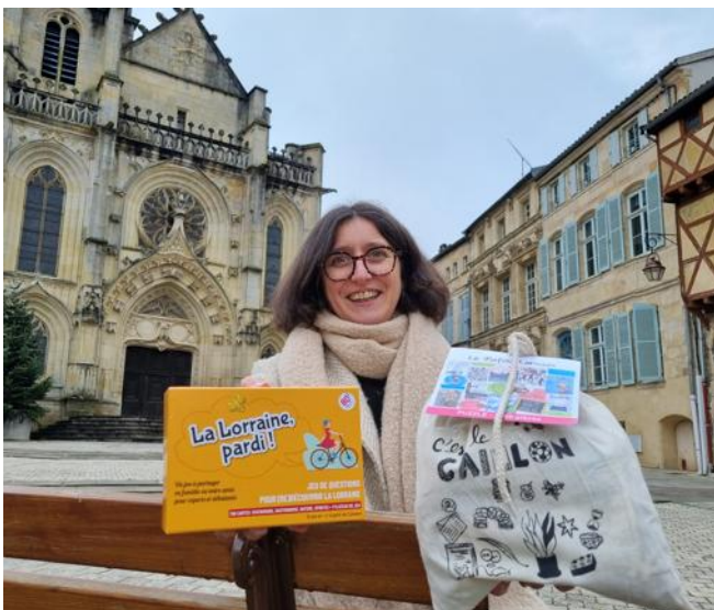
L'agence « Les 80 degrés » vient de sortir deux nouveaux produits en lien avec la Lorraine : un jeu et un puzzle.

Jeu et puzzle sont disponibles dans 25 points de vente en Lorraine et sur le site lesoleilselevealest.fr