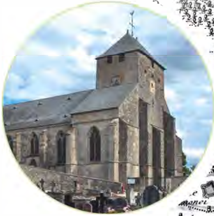
Eglise de Dun-sur-Meuse