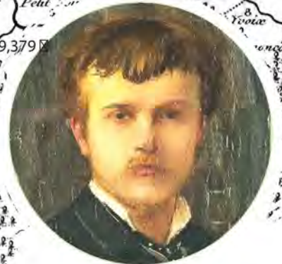
Jules Bastien-Lepage, autoportrait (Musée Jules Bastien-Lepage, Montmédy)