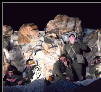
Une tranchée allemande