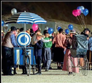
La Belle Époque